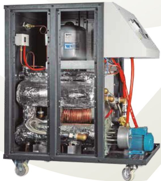
Detalle parte interior unidad de agua presurizada 180°C 180°C internal view pressurized water unit